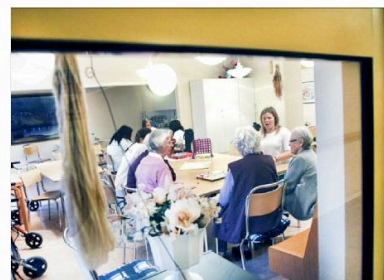
Unga och gamla har roligt ihop över spelbräderna på Armfeldt.